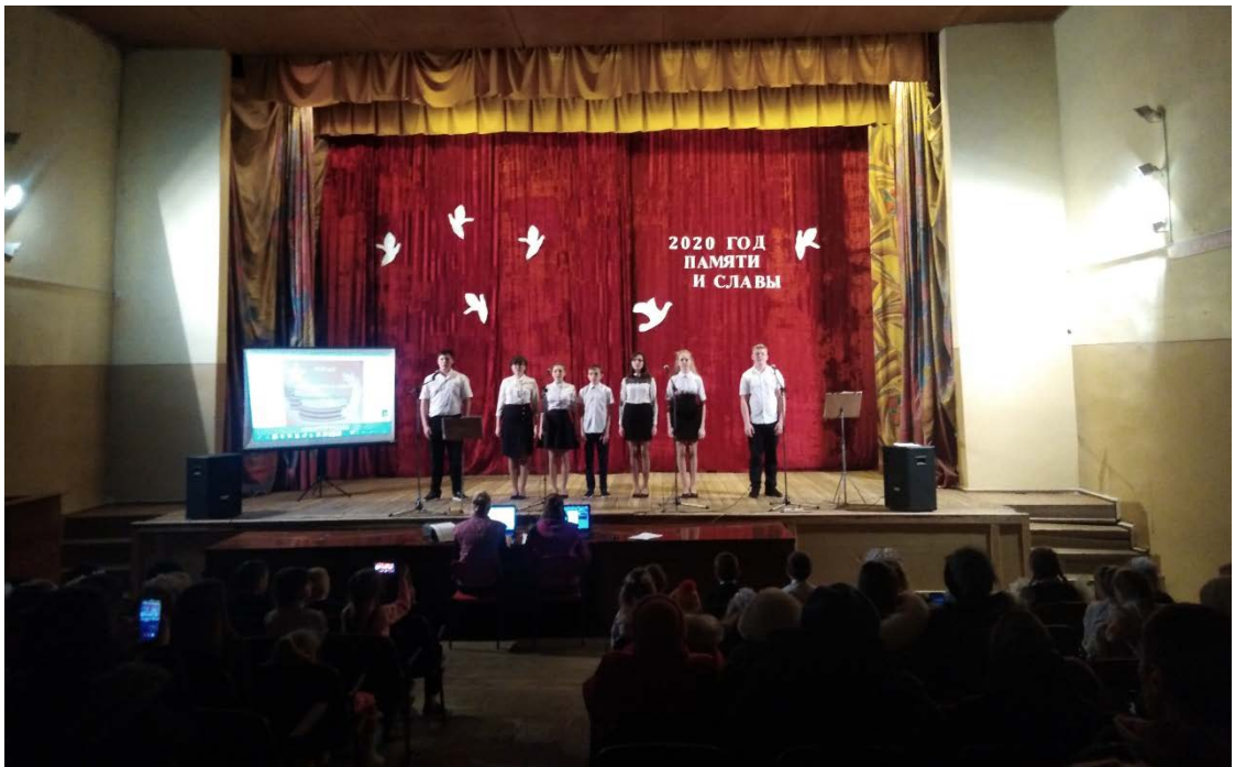
Песня «Прости меня, дедушка» Хамидуллина С., Черемисина А.

Ведущий 1. Четыре долгих года, день за днём, наш народ приближал Великую Победу. Защитники Брестской крепости, защитники Москвы, жители блокадного Ленинграда, участники Курской битвы, Сталинградского сражения, танкового сражения под Прохоровкой – ваш подвиг навечно останется в наших сердцах! «Никто не забыт! Ничто не забыто!»